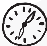
Tabela de Horários

Horário de troc as de plantão da equipe de Enfermagem :