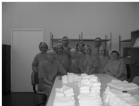
Parte da Equipe do CME

O CME caracteriza-se como uma unidade de apoio técnico a todas as unidades assistenciais, que tem como finalidade o fornecimento de materiais adequadamente processados, proporcionando desta maneira condições para o atendimento direto e assistência à saúde dos indivíduos doentes e sadios.